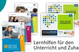
Lernhilfen für den Unterricht und Zuhause